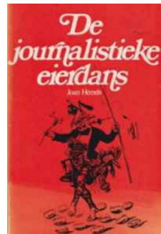
Umschlag des Buchs De journalistieke eierdans (Hemels 1972) zur Entwicklung der Debatte über die Journalistenausbildung und die universitäre Lehre und Forschung auf dem Gebiet der Presse und des Journalismus in den Niederlanden seit 1900

Letztendlich ergriffen Protestanten und Katholiken die gesetzliche Möglichkeit, eigene staatlich anerkannte und subventionierte Journalistenschulen zu gründen, und zwar auf Basis des seit 1917 in den Niederlanden im Gesetz verankerten Rechts der freien Einrichtung des Unterrichts auf allen Ebenen und für alle Bevölkerungsgruppen, die Wert legen auf Schulen ihrer eigenen Gesinnung. Ab 1978 bot die Evangelische Schule für Journalistik (Evangelische School voor Journalistiek) in Amersfoort eine christlich-orthodoxe Journalismusausbildung an. Diese wurde 1995 als Academie Journalistiek & Communicatie in die christliche Fachhochschule Ede (Christelijke Hogeschool Ede) in Ede integriert (vgl. Hemels 1974/1975; Wijfjes 2004; Meerbach 2009). 1980 öffnete die als katholische Ausbildungseinrichtung konzipierte Academie voor Journalistiek (heute: Fontys Hogeschool Journalistiek) in Tilburg ihre Türen. Ein Jahr später folgte die protestantisch-christliche Akademie in Kampen, die 1989 nach Zwolle umzog und dort in die christliche Fachhochschule Hogeschool Windesheim integriert wurde. Im Rahmen der Hochschulreform in den 1980er-Jahren wurde das dreijährige Studienprogramm der genannten vier Fachhochschulen um ein Jahr verlängert.