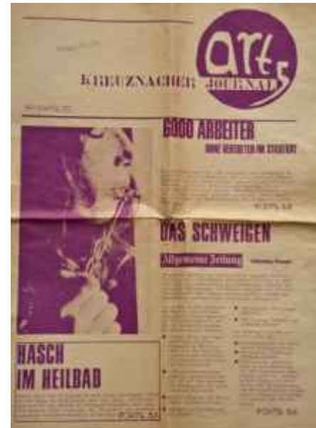
art5 in Bad Kreuznach (in Anspielung auf den Grundgesetz-Artikel,).