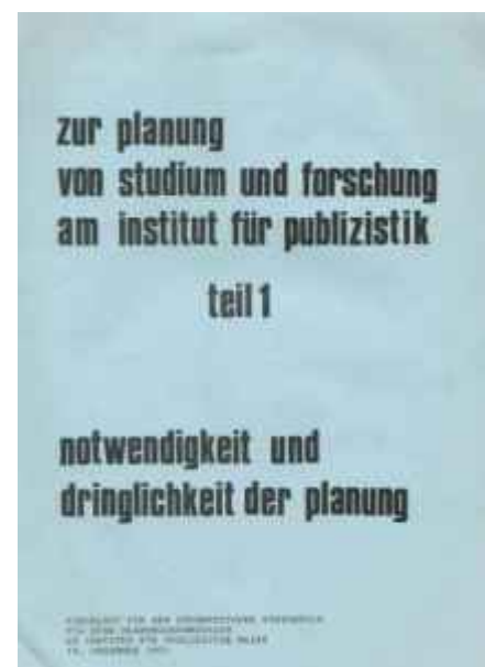
Studentische Mitbestimmung.

Berlin war das völlige Kontrastprogramm. Zum Teil hauptsächlich theorieorientiert, an Marx