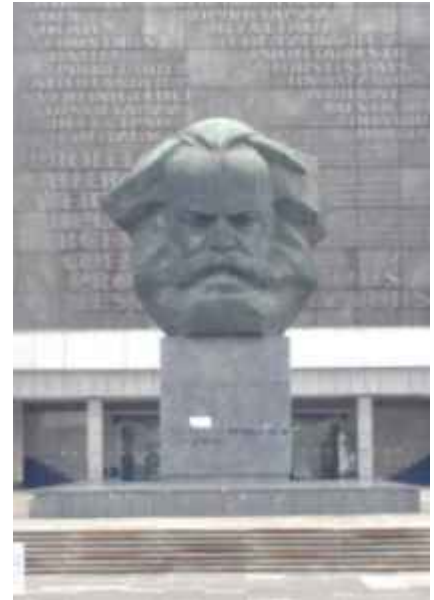
Marx in Chemnitz.