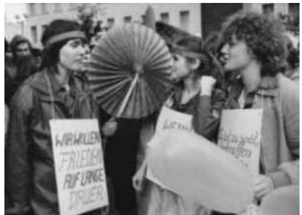
Friedensdemonstration von Leipziger Journalistikstudenten Anfang der 1980er-Jahre

Die Studenten und 90 Prozent der Lehrkräfte waren auf der Linie Gorbatschows. Vielleicht kritisieren mich die anderen Lehrkräfte dafür. Vielleicht waren es nur 80 Prozent. Die Studenten haben sich jedenfalls nicht den Mund verbieten lassen. Bei uns ging es nicht einhundertfünfzigprozentig zu. Man konnte sagen, was man wollte. Jeder wusste, dass das sowieso nicht gedruckt wird.