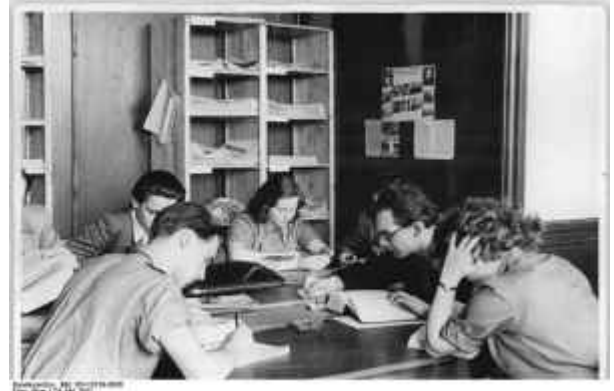
Leipziger Journalistikstudenten, 24. Mai 1951.