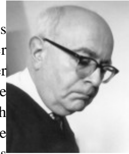
Theodor W. Adorno

Ich hatte lange die These, dass das gar keine Bewegung war, sondern dass diese Bewegung nur von den Medien herbeigeredet worden ist. In der Schweiz waren die Verhältnisse ohnehin anders. Es war alles eine Nummer kleiner, und es gab keine Gewaltherrschaft der Ordinarien. Der ganze Aufstand war eher lächerlich. Dass man Adorno diskutiert hat, fand ich anregend und wichtig. Wenn die Studenten gefragt haben, ob das Soziologie ist, habe ich natürlich Nein gesagt. Das ist Sozialphilosophie. Als Kunstsoziologe haben Sie besondere Schwierigkeiten mit Adorno. Er hat einfach aus seinen persönlichen Vorlieben ein Dogma gemacht. Noch schlimmer waren die Adorniten, die das in den Funkhäusern und im Fach nachgebetet haben. Was da alles geschrieben worden ist, als die Konjunktur günstig war, das finde ich unverzeihlich. Das hat dem Fach geschadet. Da trifft die Studenten aber keine Schuld.