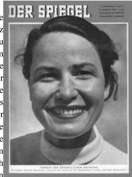
Elisabeth Noelle-Neumann auf dem Titel des Spiegel (Quelle: Der Spiegel, 21. August 1957)