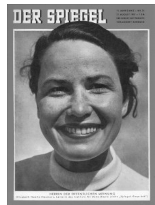
Elisabeth Noelle-Neumann auf dem Titel des Spiegel

Noelle-Neumann selbst hat die Vorwürfe zu Ihrer Vergangenheit im Dritten Reich stets